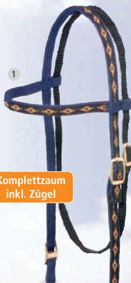
1 Komplettzaum inkl. Zügel