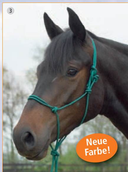
7 Neue Farbe!